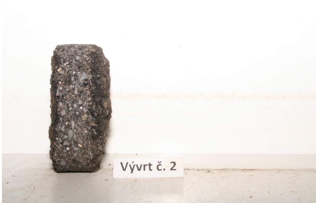
Vývrt č. 2